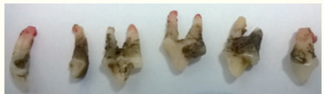
Piezas dentales extraídas por su mal estado

COMPLICACIONES DEL SARRO EN DIENTES DE PERROS: Los perros no pueden sudar para eliminar el calor corporal, ya que ellos sudan por la nariz y cojinetes de las patas, su mejor mecanismo para bajar la temperatura es jadear, esto quiere decir que inhalan aire con mayor intensidad, pero este aire antes de introducirse, pasa por las bacterias, alimento en descomposición y demás componentes del sarro, para después introducirlos a las vías aéreas, por esto, es común que los perros con sarro dental sufran de problemas respiratorios recurrentes; además, como el aire de pulmones llega a oxigenar la sangre que va directo al corazón, el sarro es un factor que puede desencadenar infecciones en corazón. Por último, y de igual importancia es el hecho de que las bacterias ingeridas al pasar al tracto digestivo predisponen a infecciones intestinales, vómitos, etc.